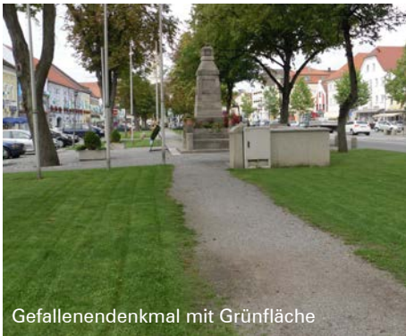
Gefallenendenkmal mit Grünfläche

Das Vorhaben zur Neugestaltung des Stadtplatzes wird mit den Mitteln der Städtebauförderung gefördert. Zusätzlich erhält die Stadt Fördermittel durch den Bund über das Förderprogramm „Anpassung urbaner ländlicher Räume an den Klimawandel“. In diesem Programm werden die Konzepte zur Ausbildung des Stadtplatzes nach den Prinzipien der Schwammstadt gefördert. Zudem werden für ein Teilbereich des Platzes die unterirdischen Maßnahmen zur Versickerung und Baumvitalisierung finanziert. Eine enge Abstimmung aller an der Konzeption beteiligten im Rahmen der weiterführenden Planungen wird zwingend erforderlich.