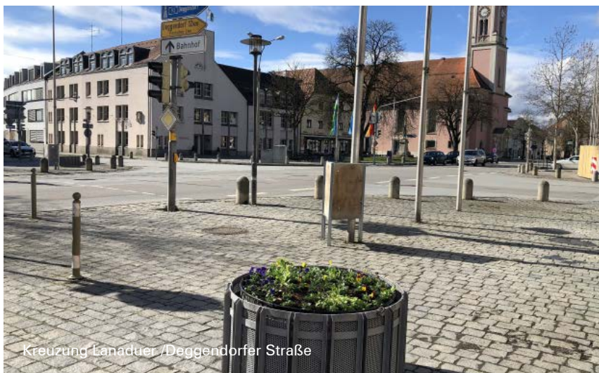
Kreuzung Lanauer / Deggendorfer Straße